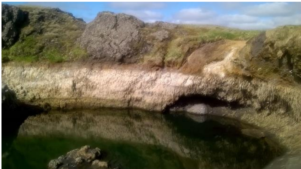
Hylur að þorna upp í Grenlæk sumarið 2016.

Mikilvægt er að varnargarðar verði endurbyggðir og stórlega bætt í uppgræðslu lands.