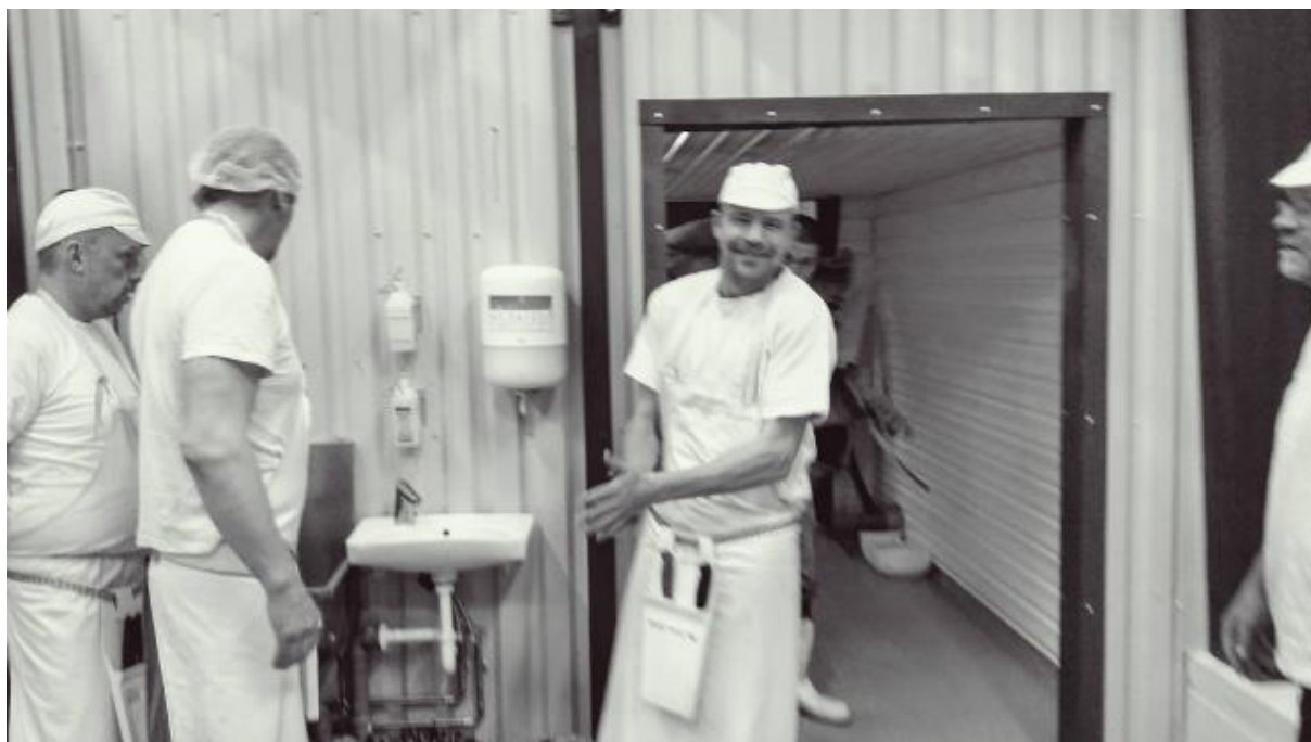
Mynd frá byrjun haustslátrunar 2016, sláturhúsið í Seglbúðum.