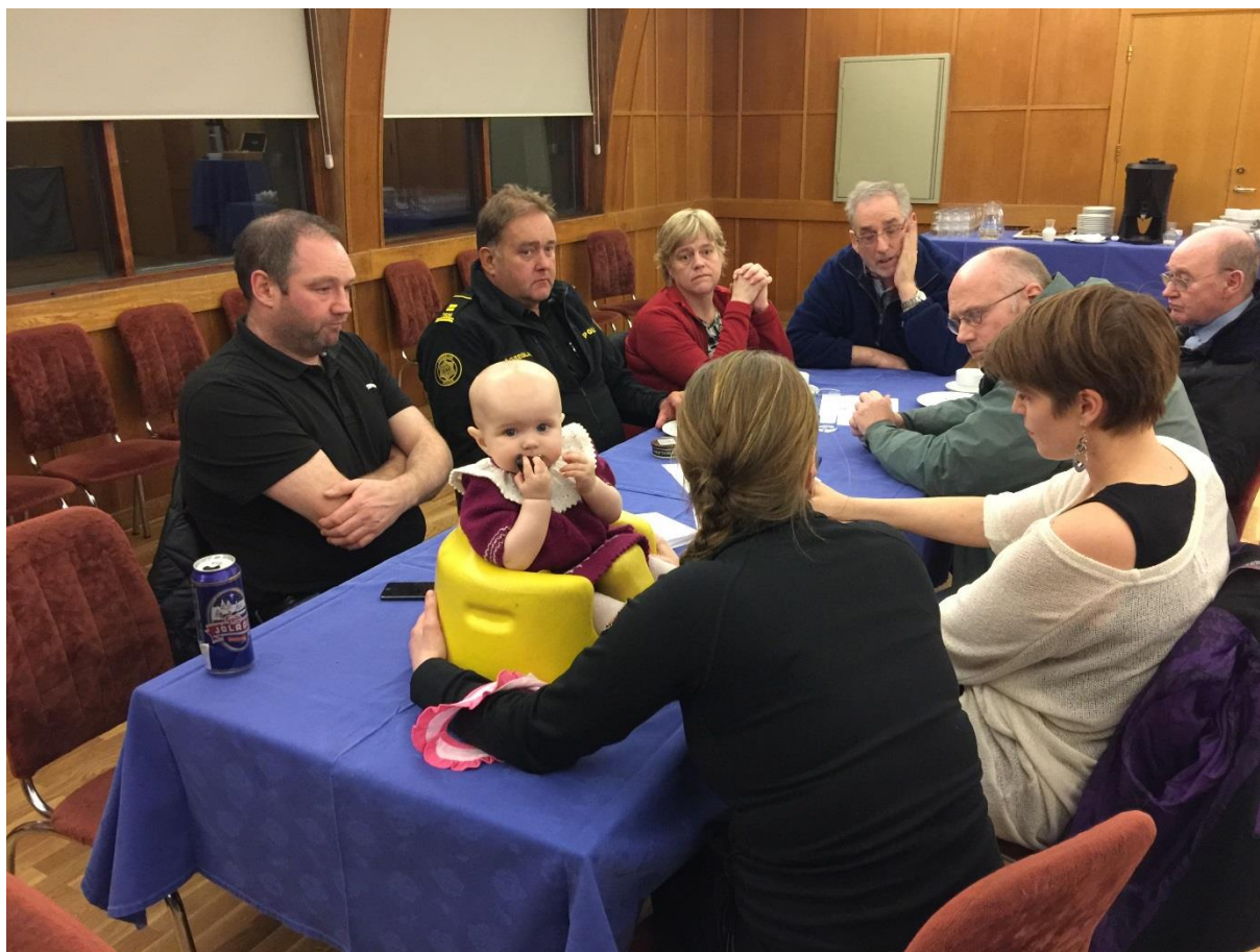
Framtíðarsýn var rædd á íbúafundi í nóvember 2015.