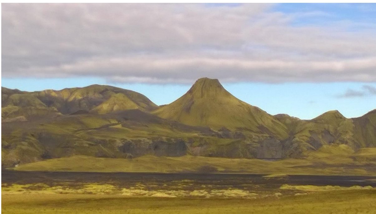
Mynd tekin á Skaftártunguafrétt, Uxatindar fyrir miðri mynd.