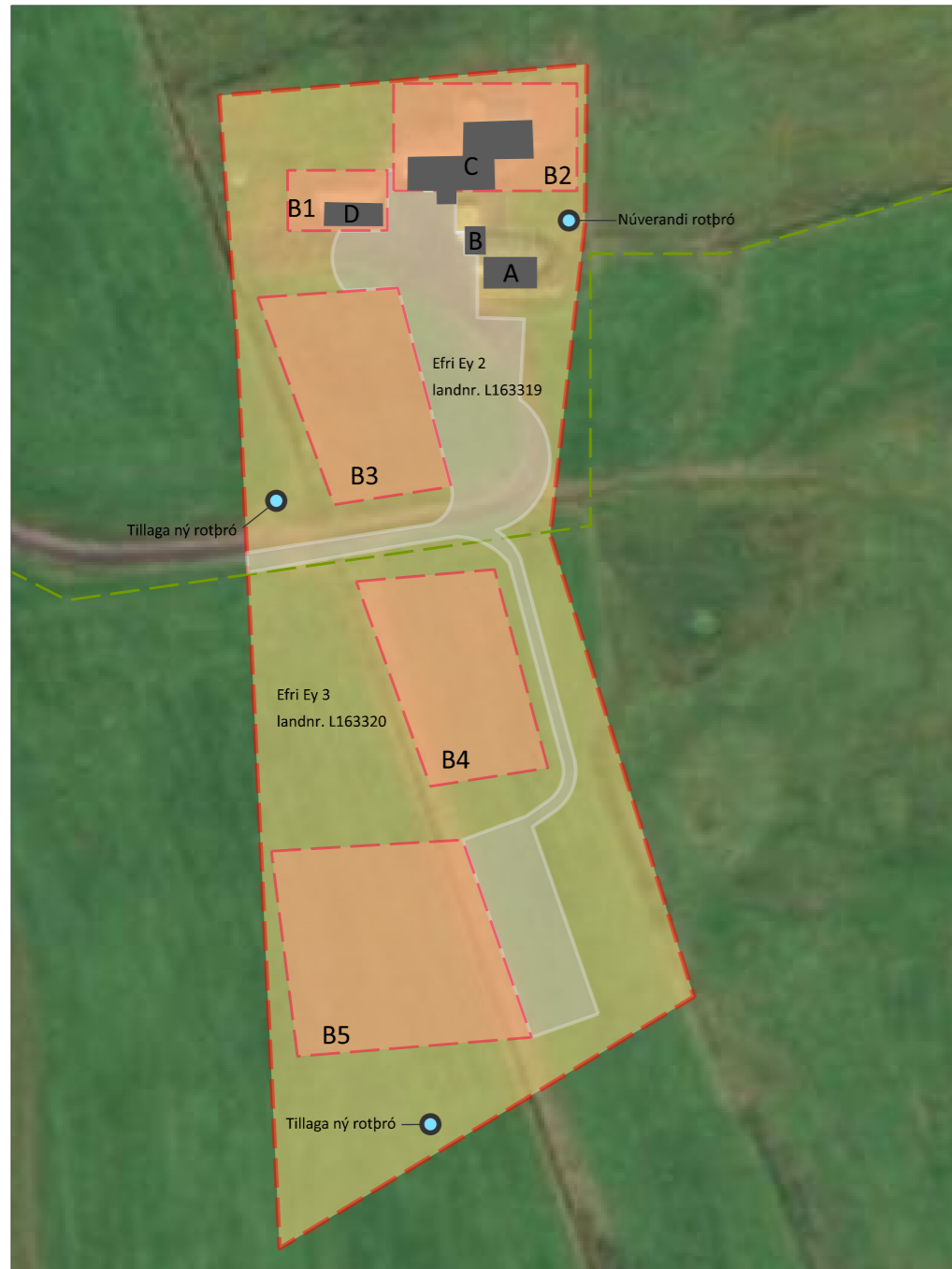
Skipulagsreitur, mkv. 1:2000