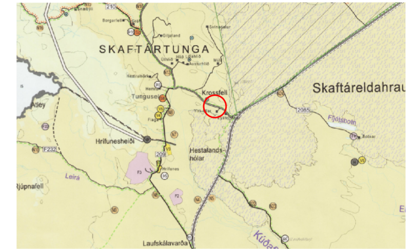
AÐALSKIPULAG SKAFTÁRHREPPS 2010-2022